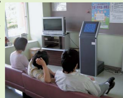
生月病院待合所にて