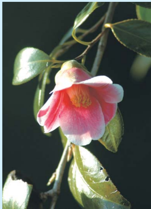
品種: 肥前薄曇(ひぜんうすぐも)

椿は身近に自生し、庭木や防風木として、また、盆栽切花用に、さらに、実は椿油に加工され、古くから私たちの暮らしにかかわりの深い花木です。