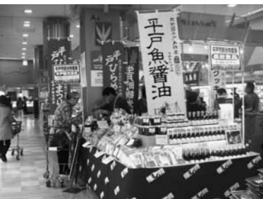
平戸観光物産展 (福岡市西区ダイエーショップズマリナタウン)

また、平戸へお客様を呼び込むには福岡と佐世保をターゲットに捉え、「本当においしいもの」と「本当に楽しいこと」を揃えれば人を呼べるという自信を深めることにつながった。