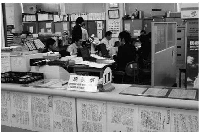
納税相談のため時間外窓口が設置されている税務課

支所の人員を減らすことは、行財政改革の観点からすれば必要であるが、合併協議の中でも確認されている「緩やかな合併」を考えると、急激な職員の削減は地域の活性化