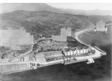
オランダ商館復元予想図