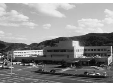
経営健全化に向けて取り組んでいる平戸市民病院

答 市民病院事務長 MRI導入事業は全体の37%5千万円が病院の持ち出しで、耐用年数6年、年間1千万円の償還。神経内科医も派遣され、受診件数も150を見込み十分やっつけける。 問 大島航路における経営効率と利便性の確保は。 答 市長 大島地区住民にとって最も良い方法を民営化検討委員会から答申されると思う。その後、行革推進のために設置する民営化検討委員会最終決定したい。基