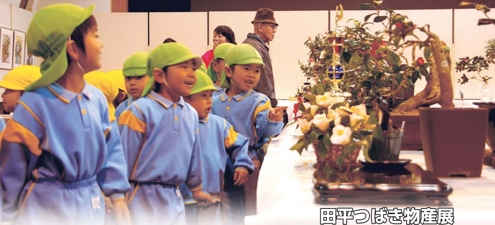
田平つばき物産展

毎年2月に、平戸市の花木「やぶ椿」を顕彰し、合わせて生け花・絵画・茶の湯などの地域文化、そして、特産品販売等による物産の振興を図ることを目的に「田平つばき物産展」が実施されています。今年で、33回目を迎えました。分野を超えて地域の各種団体が協力・連携して実施する地域の名物イベントです。