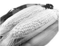
南幌町の農産物である白いとうきび「ピュアホワイト」

南幌町での農業法人化の現況を見て環境、規模は別としても本市の中山間地域に合った農業法人化の促進を早急に図って行かなければならぬと感じた。