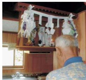
実り多い年でありますように!