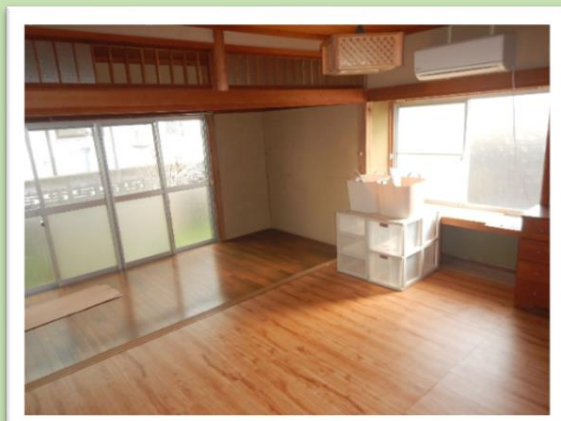
手前:洋室①(6帖),奥:洋室②(4帖)