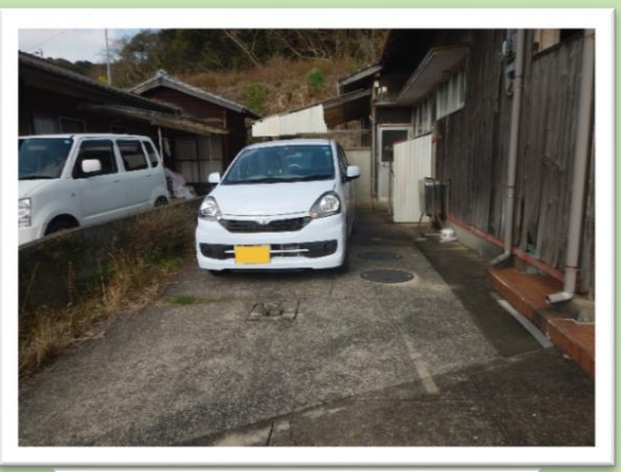
駐車スペース(縦列駐車)