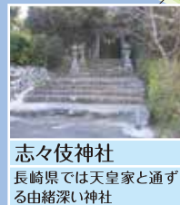
志々伎神社 長崎県では天皇家と通ずる由緒深い神社