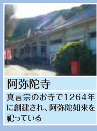
阿弥陀寺 真言宗のお寺で1264年に創建され、阿弥陀如来を祀っている