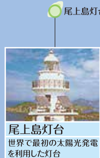
尾上島灯台 世界で最初の太陽光発電を利用した灯台

■宮の浦 四季に応じて釣りが楽しめ、チヌなど、大物も狙える。瀬渡し、磯釣りスポット。