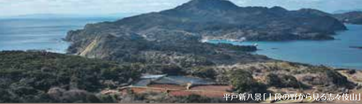
平戸新八景「上段の野から見る志々伎山」