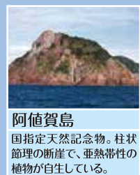
阿値賀島 国指定天然記念物。柱状節理の断崖で、亜熱帯性の植物が自生している。