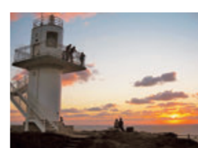
④崖の上であり、迫力満点。思わず息がすくんでしまうかも!