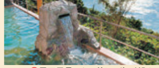
①露天風呂からは美しい海が望める ②海を眺めながら入れるインフィニティ展望露天風呂

ここで立ち寄り湯を! さむそんほてる サムソンホテル ☎0950-57-1110 (MAP) P16C2 多彩な風呂が楽しめる 美肌の湯といわれ、女性客に好評。平成29年(2017)に家族風呂がリニューアル。④平戸市田平町野田免210-6 ⑤松浦鉄道たびら平戸口駅から車で5分 ⑥入浴900円 ⑦入浴11～23時(水曜は15時～) ⑧無休 P100台