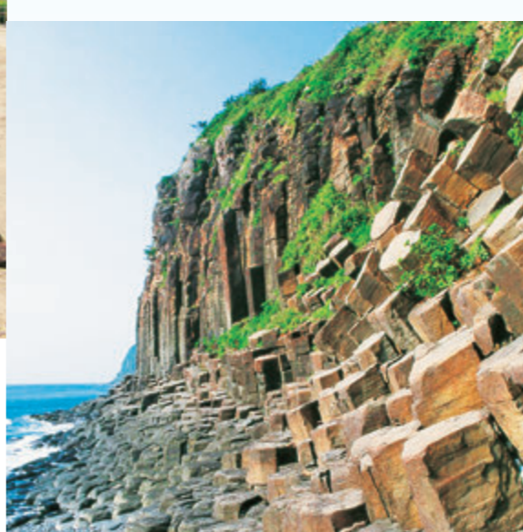
④石の柱がいくつも重なって立っているように見える