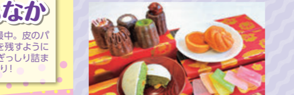
長崎デザインアワード2022大賞受賞商品

2022年春に誕生した「平戸百菓繚乱」は「百菓之図」をモチーフに、平戸市内の菓子店が現代風に復刻・アレンジしたスイーツブランド。平戸オランダ商館などで購入できる。