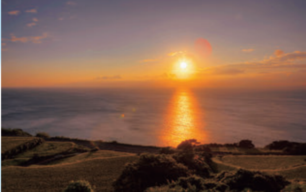
④天気によれば水平線に沈んでゆく大きな夕陽を見ることができる