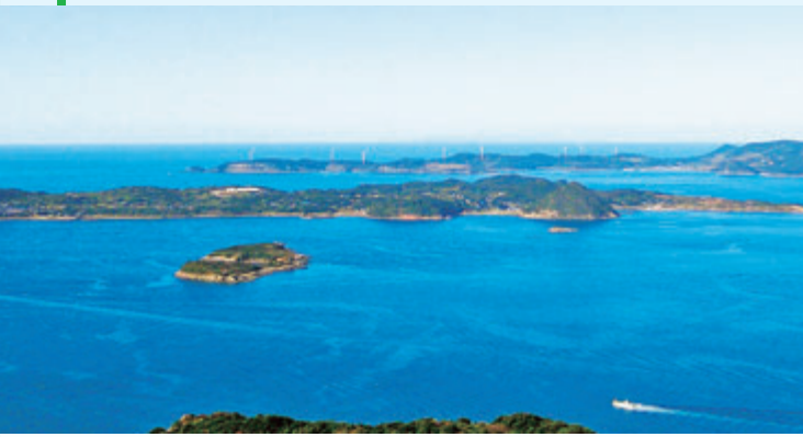
⑨入り組んだ海岸線に広がる穏やかな海は、眺めているだけで癒される