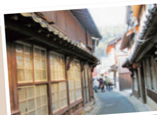
④国の重要伝統的建造物群保存地区に選定され、江戸時代からの漁村集落の姿が残る