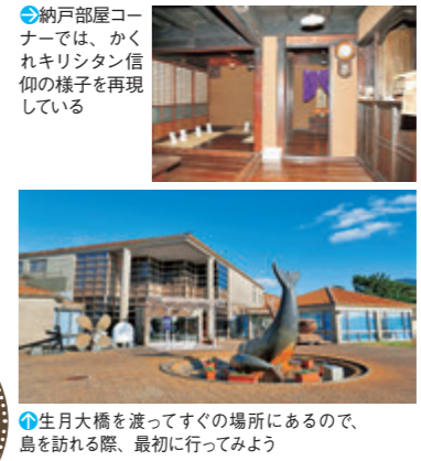
④生月大橋を渡ってすぐの場所にあるので、島を訪れる際、最初に行ってみよう

領民の多くが改宗。一斉に広がったキリスト教 平戸松浦家25代当主、松浦隆信(道可)が天文19年(1550)にポルトガル船との貿易を始めたこととが、平戸のキリスト教伝来の始まり。フランシスコ・ザビエルらによって布教が積極的に行われ、家老・籠手田氏と弟の一部氏も入信。彼らの領地に住む人々は改宗させられ、平戸に多くのキリスト教信者が生まれた。