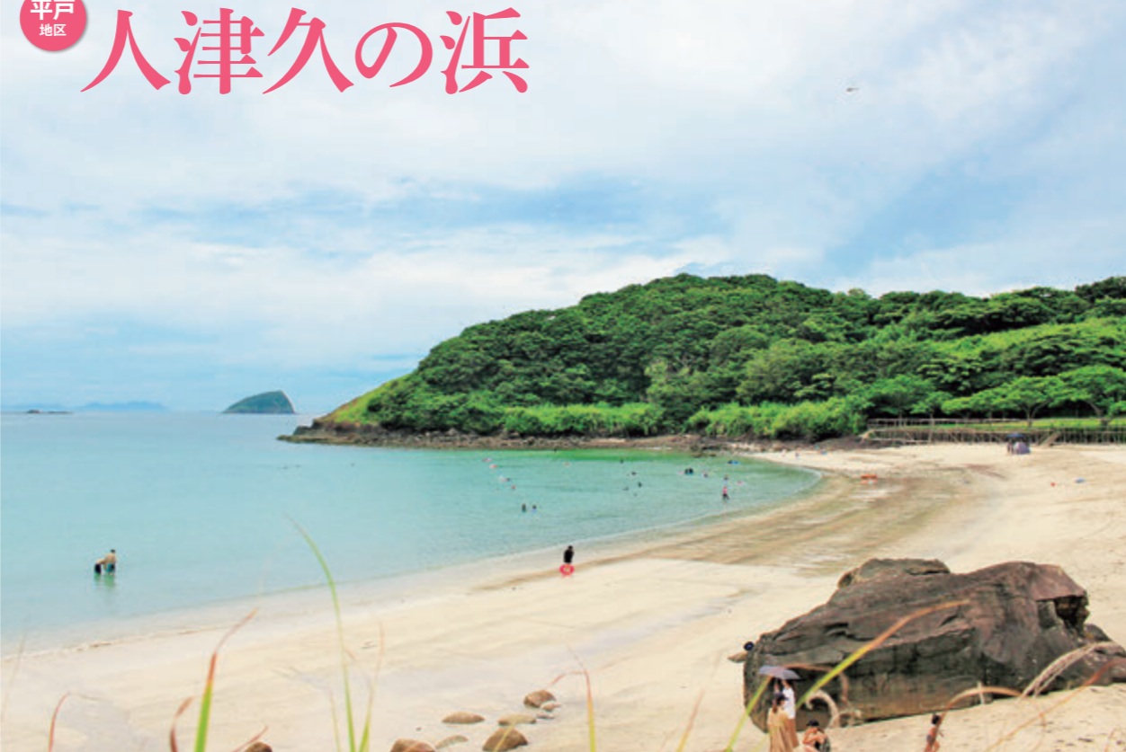
④入江になっていて、対岸の景色も楽しめる