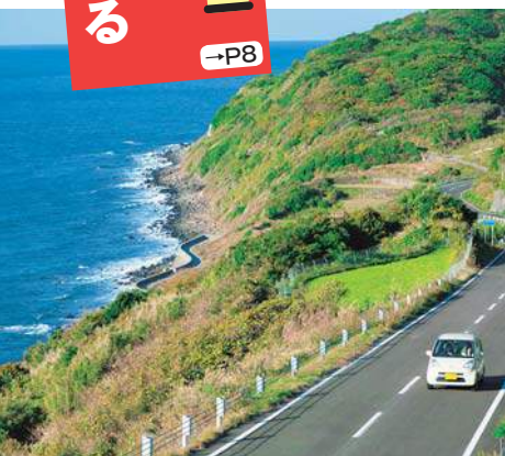
生月島の「サンセットウェイ」(→P9)は最高のドライブタイムを約束