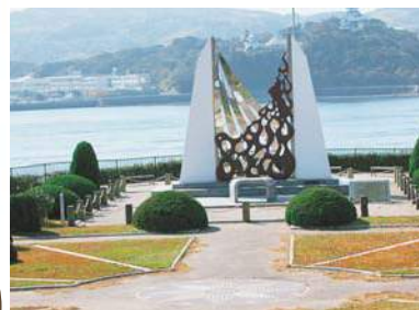
⑨ 碑はまさに炎が天に見るようなデザイン

③ 平戸市田平町野田免210 ④ 平戸大橋から車 で5分 ⑤ ⑥ ⑦ 見学自由 ⑧ 10台