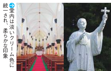
⑨ 室内は淡いクリーム色に 統一され、柔らかな印象

③ 平戸市田平町小手田免19 ④ 1階部分に 西肥バス天主堂前バス停から徒 あるスタンド 歩すぐ ⑤ 拝観無料 ⑥ 9~17時 グラス。ダイナ (ミサの時は見学不可) ⑦ 無休 ミックな構図が ⑧ 20台 特徴だ