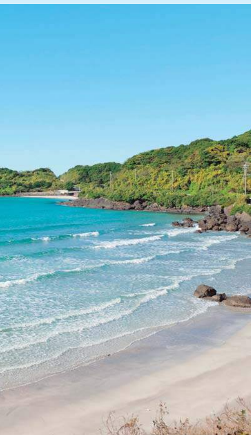
①入江になっていて、対岸の景色も楽しめる