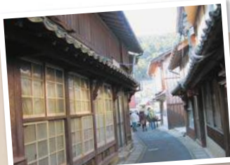
①国の重要伝統的建造物保存地区に選定され、江戸時代からの漁村集落の姿が残っている

手つかずの美しい自然や景観が残る的山大島。中でもオススメなのが江戸期からの木造建築が残る「神浦地区の町並み」。家々の凝った腕木や意匠などが見られ、歴史を感じられる。島内の移動は車がベターなので、車ごとフェリーに乗船するのがよい。