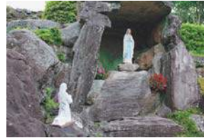
② 天主堂の敷地内には聖地「ルルド」も