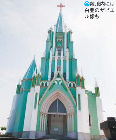
⑨ 平戸の市街地を望む丘の上に立つ

③ 平戸市鏡川町269 ④ 西肥バス平戸市役所 前バス停から徒歩10分 ⑤ 拝観無料 ⑥ 8~ 16時(ミサの時は見学不可) ⑦ 無休 ⑧ 30台