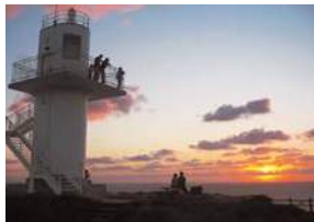
①崖の上にあり迫力満点。思わず足がすくんでしまうかも!