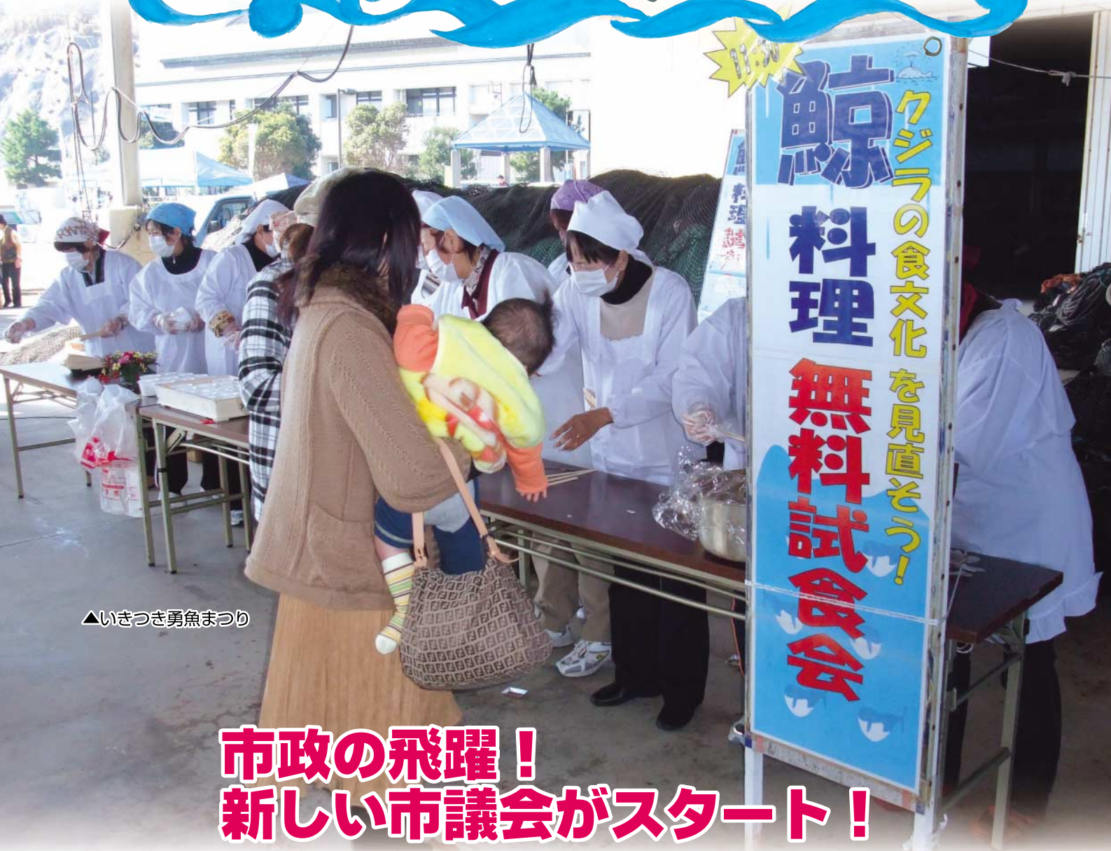
▲いきつき勇魚まつり