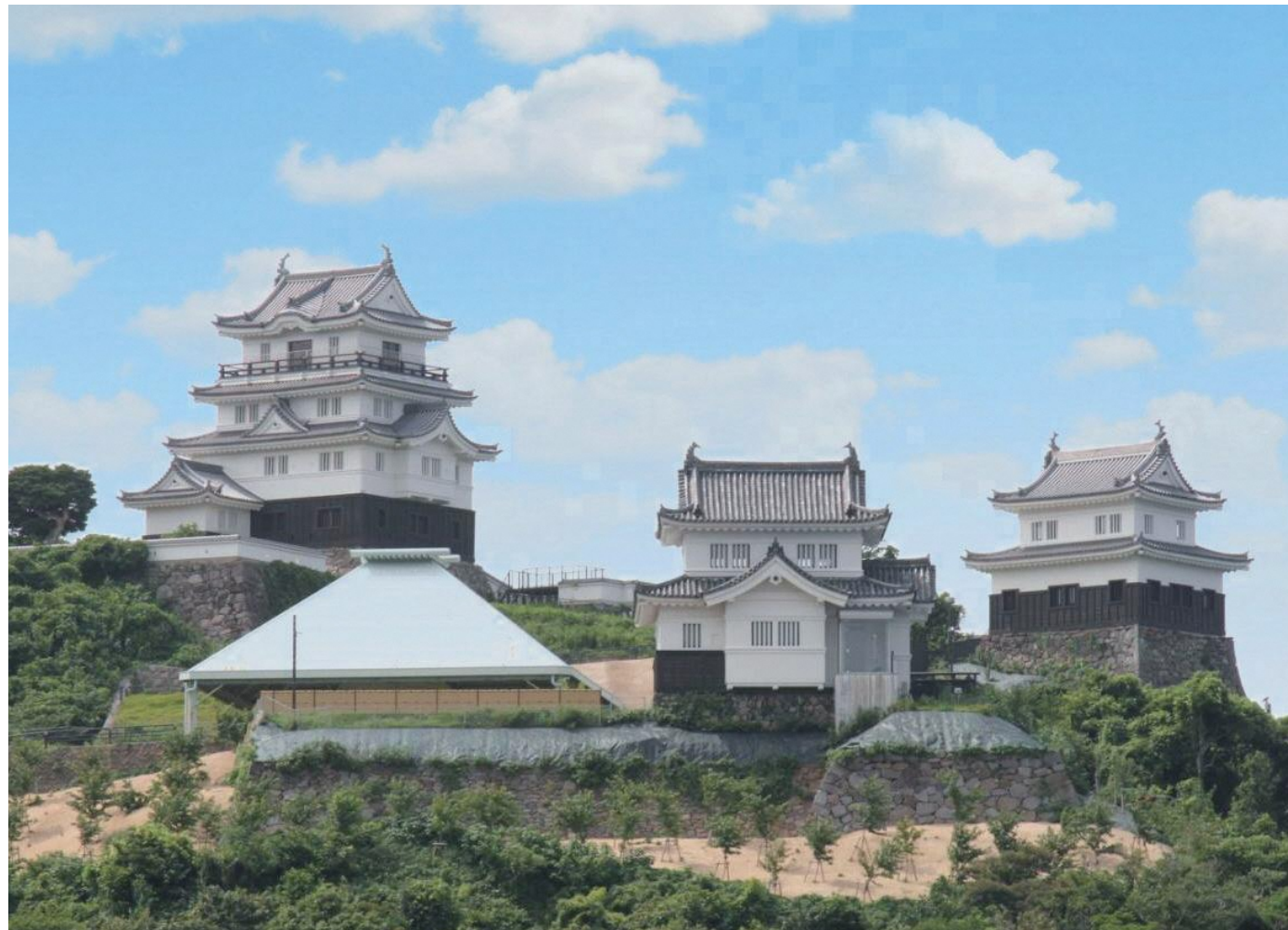
平戸城、キャッスルステイ懐柔櫓、見奏櫓