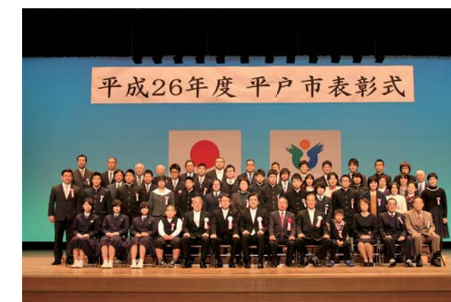
教育委員会表彰・スポーツ表彰