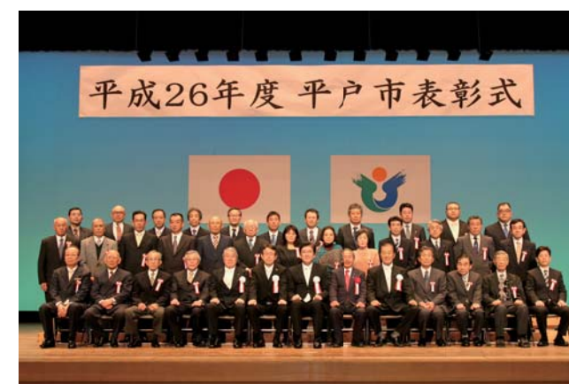
市民表彰・景観表彰・生涯学習まちづくり表彰

2月22日、平戸文化センターで行われた「平成26年度平戸市表彰式」で、市民表彰、景観表彰、生涯学習まちづくり表彰、教育委員会表彰、スポーツ表彰を受賞した皆さん。受賞おめでとうございました。