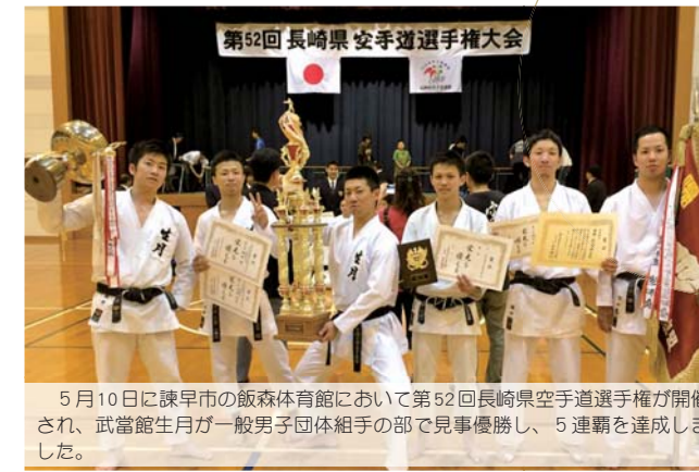
5月10日に諫早市の飯森体育館において第52回長崎県空手道選手権大会が開催され、武當館生月が一般男子団体組手の部で見事優勝し、5連覇を達成しました。