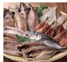
平戸市近海で水揚げされた 魚の干物