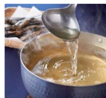
上質で深い旨みの 添加物不使用のあごだし