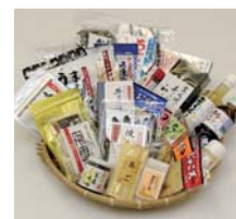
「あごだし」などの 農水産加工品