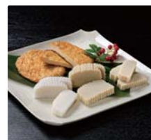
平戸特産の川内かまぼこや 豊富な種類のすり身揚げ