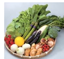
平戸から直送の 旬の農産物