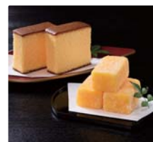
平戸特産の伝統和菓子 などの各種スイーツ