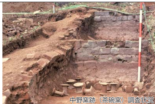
中野窯跡(茶碗窯)調査状況

中野窯は、文禄・慶長の役で朝鮮半島から連れ帰った陶工によって開かれたとされる平戸藩の御用窯で、慶安3年(1650)に三川内へ移るまでの間、磁器を中心に焼物が焼かれていました。国内で最も早いトンバイ(耐火レンガ)を使用した窯として知られ、洗練された製品を生産していたことが確認されています。