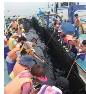
▲外国人にも人気の漁師体験

観光施設入場者数は261,347人と前年より3万4,461人(対前年比115.2%)増加しました。平成26年3月末から集計を開始した田平天主堂は、対前年比213.8%と前年を大きく上回りました。また近年減少傾向にあった平戸城では、夏の旅行商品「平戸で遊ぼう」の体験メニューとして、お化け屋敷を開催したことで入場者数が伸びています。