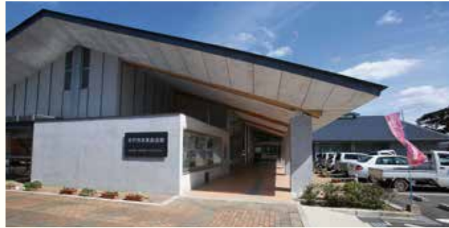
平戸市未来創造館