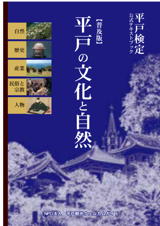
平戸検定公式テキストブック普及版