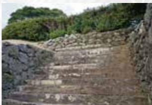
教会駐車場下に残る石段