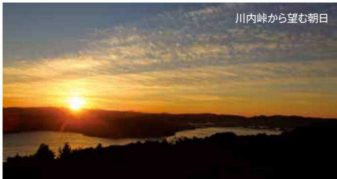
川内峠から望む朝日

結びに、この一年が皆さまにとりまして、限りなくお幸せで明るく元氣な飛躍の年になりますことをお祈り申し上げます。年頭のあいさつといたします。