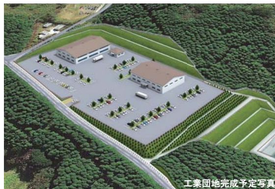
工業団地完成予定写真

工業団地整備事業（特別会計）・・・2億7,504万円（一般会計繰出金415万円）