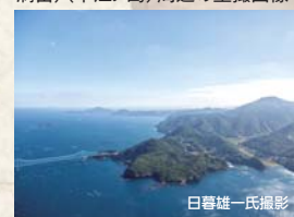
昨年9月上旬に「イコモス調査」が行われ、「平戸の聖地と集落(春日集落と安満岳)(中江ノ島)」の現地調査も行われています。