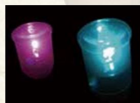
11月からの1カ月間、5千個のLEDライトが棚田を彩ります。