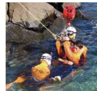
合同水難救助訓練の様子

※訓練実施の際は緊急車両などの出入りがありますので、事件・事故とお間違いないようお願いいたします。