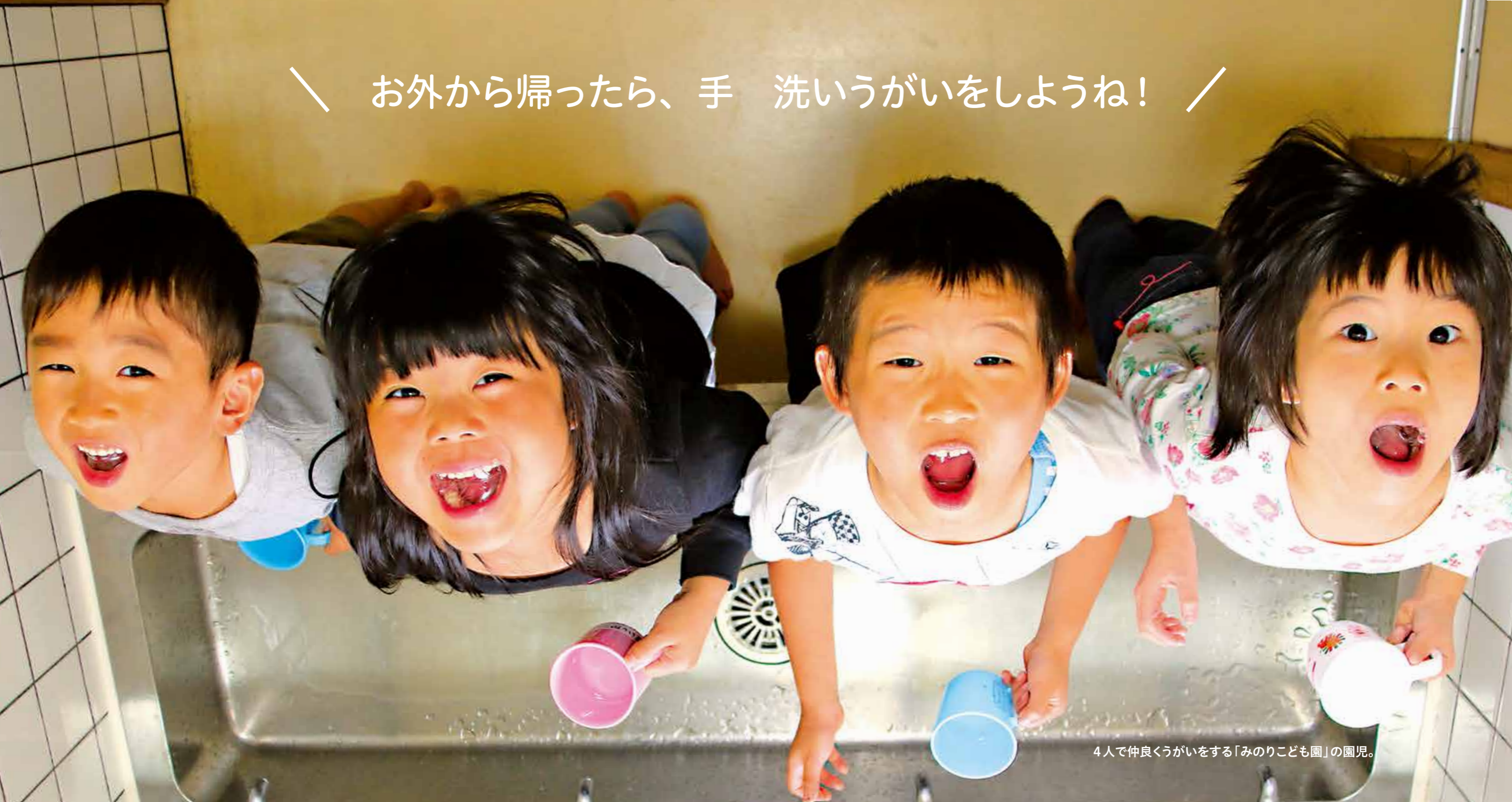
4人で仲良くうがいをする「みのりこども園」の園児。