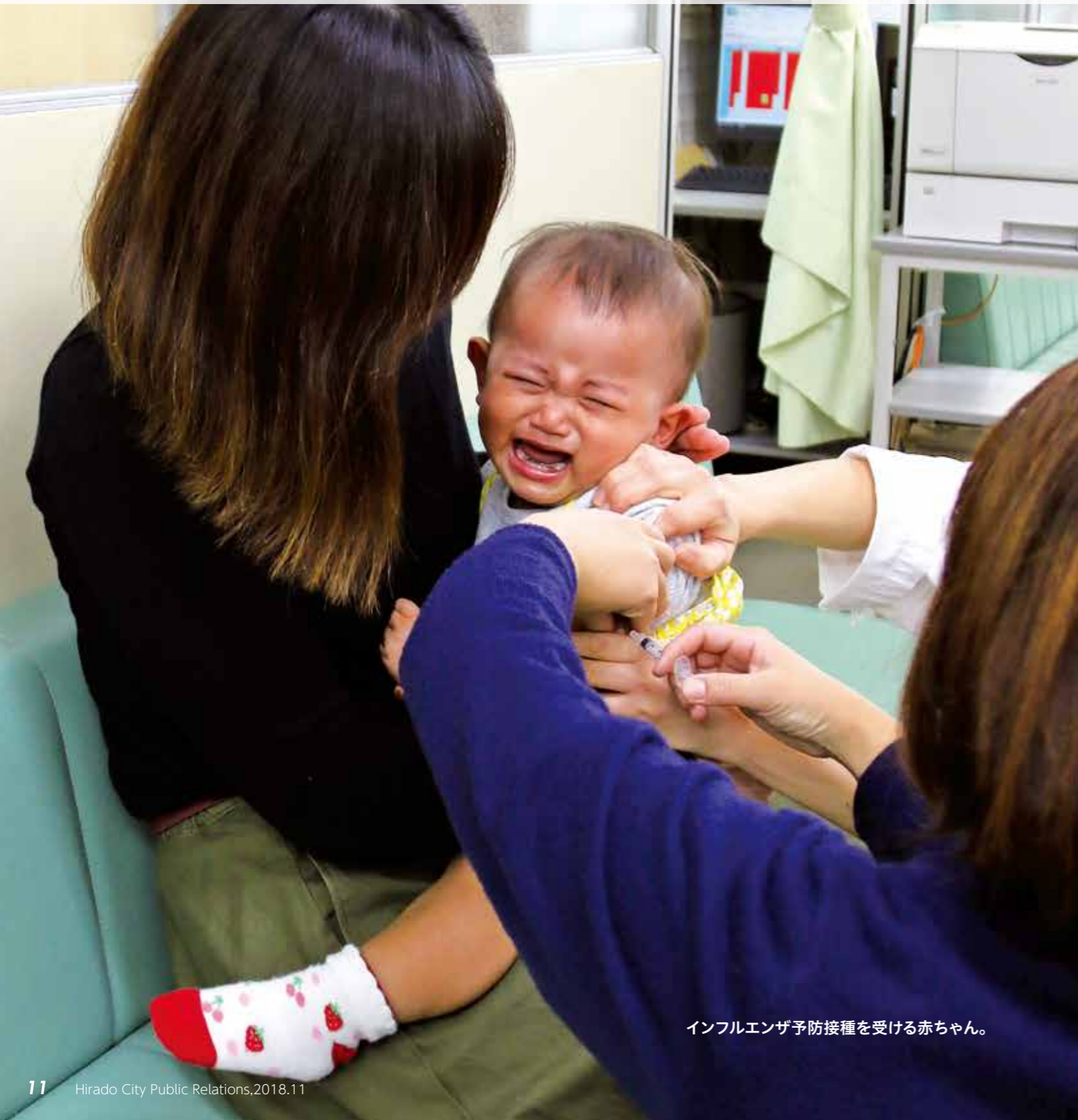
インフルエンザ予防接種を受ける赤ちゃん。

インフルエンザは、普段の体調管理と予防対策である程度防げます。また予防接種をすることで、かかっても軽く済む場合もあります。これから流行するであろうインフルエンザに対して「かからない」「うつさない」ため、感染症の正しい知識や普段の衛生習慣、病氣にかかりにくい健康な体を身に付けてください。自分自身やあなた大切な人の命を守ることもつながります。