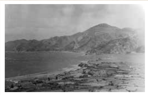
昭和30年代の潮見崎周辺

右上の写真は、生月島南端の潮見崎周辺を昭和30年代に撮影したもので、生月大橋架橋(1991年)以前の景観が分かる一葉です。撮影地点は背後の山地にある霊場「お滝様」付近と思われます。