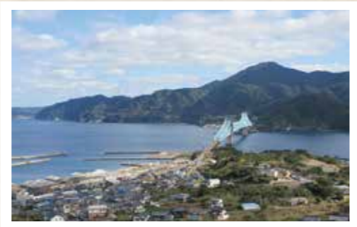
現在の潮見崎周辺

現在の潮見崎付近には低い林や竹藪の中に、島の館や住宅が建っていますが、かつては麦や芋を栽培する畑が一面に広がっていました。岬の先端には平戸島との間に渡された電線の鉄塔と潮見神社の大松が確認できます。左(館浦港側)の潮見地区には魚油や煮干しを製造する加工場が並び、端には1955年に建てられ現在も残る公営アパートが見えます。