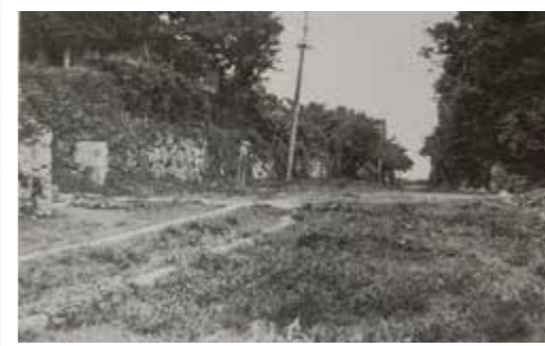
昭和3年ごろの大久保の馬場

右上の写真は昭和3年ごろの「大久保の馬場」(現在の大久保の馬場バス停付近)です。馬場とは本来馬の教練、あるいは乗馬の練習に使用された場所であり、直線に造られています。平戸では、馬場は基本的に武家屋敷が存在したところであり、市街地ではほかに最教寺付近の「追廻の馬場」や「稗田の馬場」などが知られています。