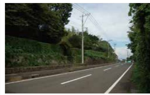
現在の大久保の馬場

大久保の馬場は明治維新まで利用されていたようで、幅20m、長さ150mほどあったと思われます。馬場の両側には、武家屋敷の石垣を見ることができ、昔の風景をしのぶことができます。