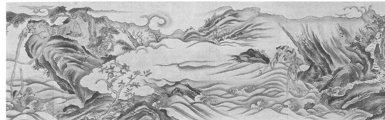
▼禁裡荒海障子図(徐皞晋写)