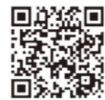
▲法務省ホームページ

○ 問 人事課秘書広報班 ☎22-9102 広報ひらど6月1日号において、下記のとおり誤りがありましたので、お詫びして訂正します。 ○23ページの空き家アドバイザー協議会平戸支部事務局の電話番号 誤 0959-63-3785 → 正 0956-63-3785