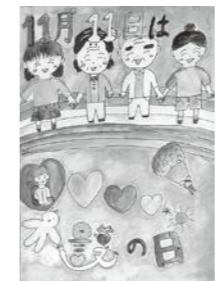
▲令和4年度優秀作品