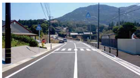
▲市道山中・紐差線の昨年度整備箇所