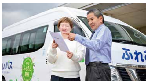
▲中南部地区を運行する平戸市ふれあいバス