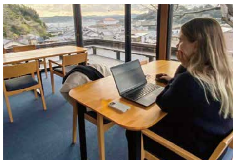
▲場所に縛られずに好きな場所で働くデジタルノマド