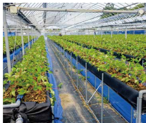
▲平戸式もうかる農業実現支援事業で整備したイチゴハウス