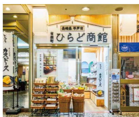
▲東京都有楽町にあるアンテナショップ「ひらど商館」