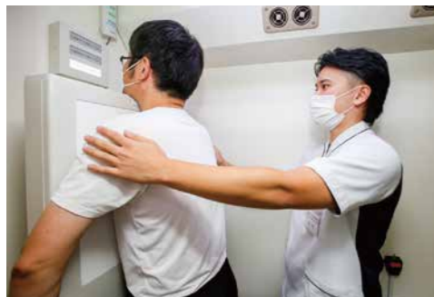
▲がん検診での胸部X線検査の様子