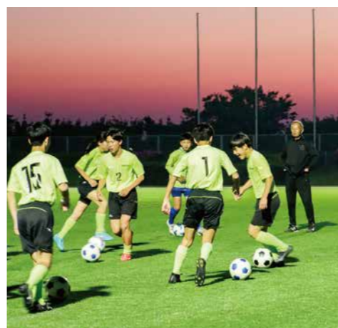
▲平戸市内各地域から集まって活動を行う認定地域クラブ