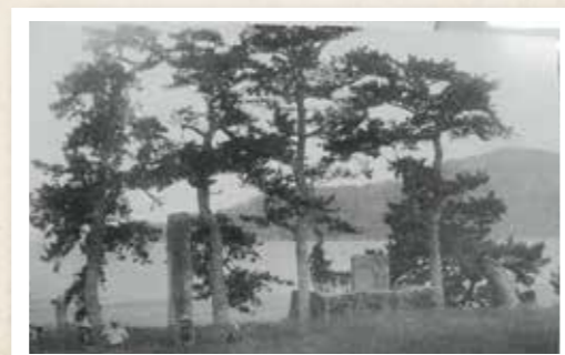
1859年に千里が浜に建立された鄭成功碑

右下の写真は、千里が浜にある松木の下に鄭成功碑が建てられています。この碑は平戸生まれの英雄鄭成功の生涯を、約1,500字に及ぶ漢字を刻んで紹介しており、1859年に平戸藩により、ゆかりのある千里が浜に建立され、平戸市の文化財になっています。現在も中国南安市から贈られた鄭成功像とともに、千里が浜に静かに佇んでいます。