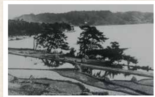
昭和初期の千里が浜の様子

右上の写真は昭和初期の千里が浜の様子です。現在の姿からはかけ離れていますが、松のある浜辺や稲干しなど、昔はこうしたのどかな風景が広がっていました。昭和の初めに、千里が浜で運動会が開催された写真や、珍しかった水上機が飛来し、多くの人が見物に訪れる様子など、賑わいのある写真も残されています。当時の人たちにとっては、さまざまなイベントの場として貴重な浜でもあったようです。