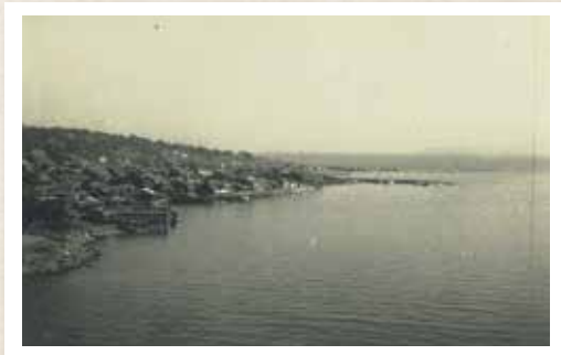
昭和初期の壱部浦の風景

現在では、手前側の海岸は埋め立てられ、介護施設や開発センター、生月支所が立ち並んでいます。