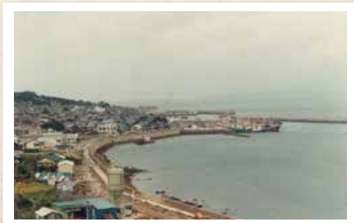
昭和50年代後半ごろの壱部浦の風景