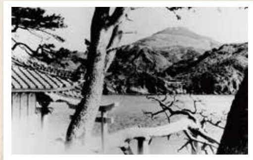
潮見神社から見た安満岳

下の写真は、潮見鼻に祀られている潮見神社の社殿越しに對岸の安満岳を撮影した一葉です。手前には潮見神社の境内に生えた大松の幹が映っています。松は昭和40年代に白蟻の被害に遭い伐採されましたが、かつての潮見神社は大松も含めて風光明媚な景観が人気で、生月島民の身近なピクニックの場所になっていました。