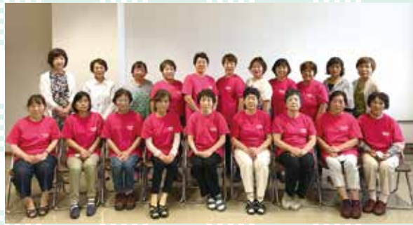
中部支部「むつば会」