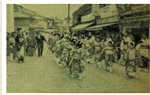
昭和41年の平戸のおくんち