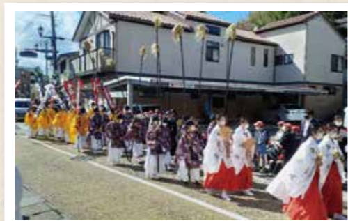
令和4年の平戸のおくんち