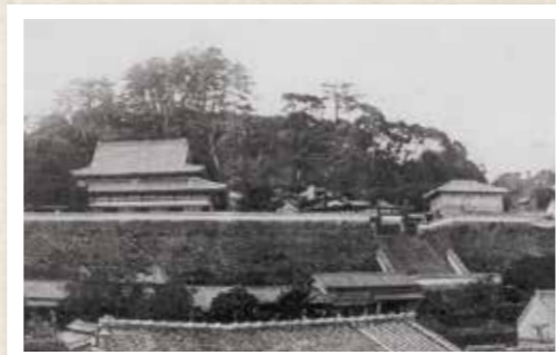
明治末～大正期の鶴ヶ峰邸

千歳閣は、主に謁見の間として利用され、内部の照明はシャンデリア風であり、屋根裏に一部トラス構造が見られるなど、洋風建築の要素も取り入れられています。九草齋は、千歳閣の西側に位置する和風の書院造で私的な客間として利用されていたとされています。