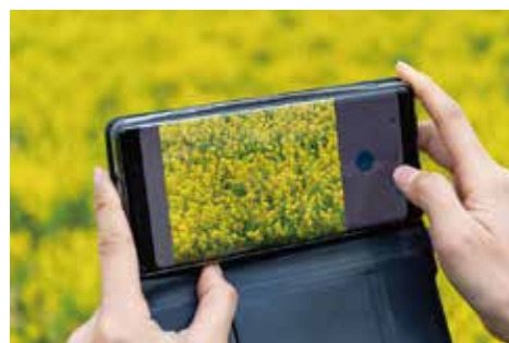
高画質のカメラで写真や動画を撮影