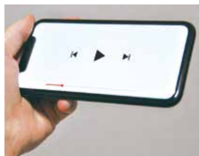
好きな動画をどこでも閲覧