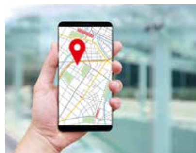
地図やナビで迷わず旅行