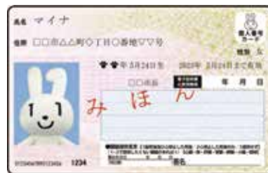
▲マイナンバーカードの見本