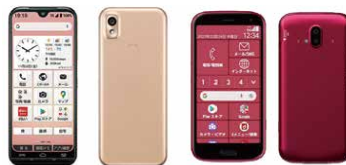
▲高齢者向けスマホの例

スマホにはパスワードに加えて、指紋認証や顔認証などの機能があり、本人以外が操作できないよう制限することができるので、安心して利用できます。 ※機種によって利用できる認証機能が異なります。