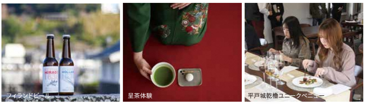
フィランドビール 呈茶体験 平戸城乾櫓ユニークベニュー

今後も、豊富な食材と歴史や文化を融合したガストロノミーツーリズムを推進し、新たな観光誘客に繋がるようなイベントの開催や旅行商品の販売を行う予定です。