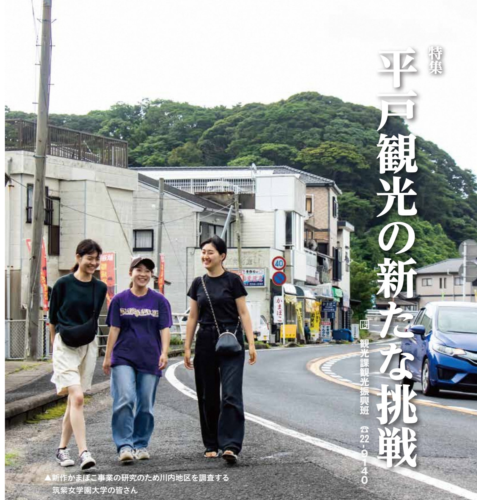
▲新作かまぼこ事業の研究のため川内地区を調査する 筑紫女学園大学の皆さん

歴史・雄大な自然景観、豊富な食材など、多様な観光資源に恵まれている平戸市には、これまでも多くの観光客が訪れていました。新型コロナウイルス感染症の感染症法上の取り扱いが変更され、今後は外国からの観光需要「インバウンド」の拡大が期待できます。