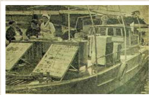
島に着いた栄養指導船(昭和36年撮影)

度島についたキッチン・ボート(栄養指導船)の様子を映した昭和36年ごろの写真です。結核解消と食生活の改善を目指して運用されていました。平戸島、生月島、小値賀、的山大島などを巡航していたそうです。船名は「あけぼの丸」19トン、この当時九州では1艘しかなく、栄養士が1人、船長を含め船員は3人で運行されていたようです。電気冷蔵庫、ガスレンジ、電気調理器を備え船上で料理をしていたようで、船上特有の波による調理器具が滑ったりしたことも記録されています。しけで動けないときなどは船員は船内に宿泊し、栄養士は陸に上がって旅館に宿泊していたことも記録されています。今ほど情報が簡単に入る環境ではない中、画期的で最新の情報を届けてくれる貴重な機会となっていたのではないのでしょうか。