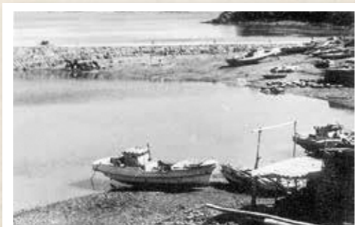
飯盛漁港の様子(昭和30年代撮影)