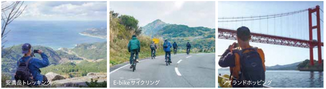
安満岳トレッキング E-bikeサイクリング アイランドホッピング

なお、今年度は北海道で開催されるATWS(アドベンチャーツーリズムワールドサミット)に参加し、商品化を行い、更なるインバウンド誘客を目指します。