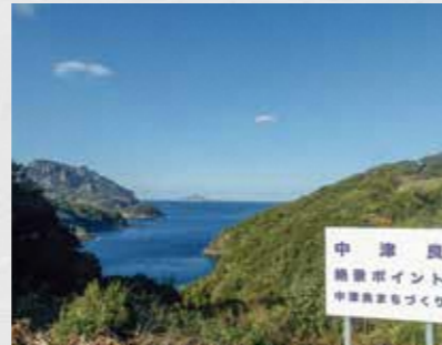
▲中津良絶景ポイント

中津良地区まちづくり運営協議会 ☎22-7835 津吉地区まちづくり運営協議会 ☎27-0611 志々伎地区まちづくり運営協議会 ☎29-1510 野子地区まちづくり運営協議会 ☎27-1613