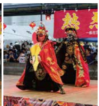
▲歓迎演目(変面ショー)