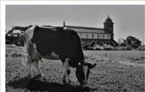
昭和30年代の田平教会

右上の写真は、今から約60年ほど前の昭和30年 代のもので、教会の姿は現在とほぼ変わらない様子 です。現在では、かつて畑だった教会横に駐車場が 造られています。