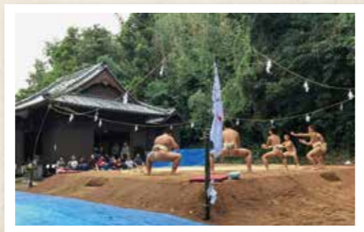
数年前の八朔相撲