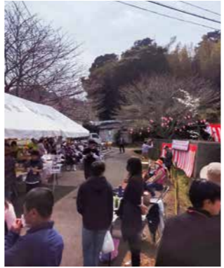
▲訪れた人たちにぎわう春まつり