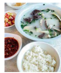
▲薄切りの羊肉が入った体温まる「羊肉スープ」