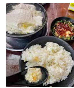
▲やわらかい豆花をタレにつけてご飯と一緒に食べる「豆花飯」