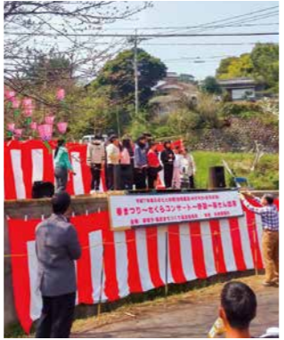
▲3月末で閉校した根獅子小学校の児童から先生へ向けて感謝を伝える姿

面や思うようにいかなかった点も多くありました。しかし、先輩スタッフに支えてもらい、地域の皆さんと協力して一つのイベントをつくり上げる喜びや達成感を強く感じる事ができました。今回の反省と改善点を、来年の春まつりにしっかり活かしたいと思います。