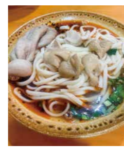
▲豚のホルモンが入った辛くて香りの強い「肥腸麵」

中国の朝ごはん文化は、街のあちこちで生まれていきます。多くの店は午前5〜6時ごろから開き、湯気の立つ温かい食べ物が並びます。こうした朝の風景は、とても生活感があり、一日の始まりを感じさせてくれます。 中国では、地域ごとに朝ごはんのスタイルも大きく異なります。 北の地域では、麺食が多く、煎餅、肉まんにおかゆ、豆乳に揚げパンなどがよく食べられます。南の地域では米を使った料理が多く、特に広東の「飲茶」が有名です。家族と話しながらゆっくり楽しむスタイルで、蒸したての腸粉、米粉、エビ餃子、鶏の足(もみじ)、ミルクティーなどが一