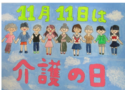
令和5年度優秀賞作品 ▲小学生の部

福祉・介護に関する啓発を重点的に実施する日として、「いい日、いい日、毎日、あったか介護ありがとう」を念頭に、「いい日、いい日」にかけ、11月11日は「介護の日」と定められています。