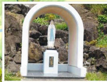
【ルルドのマリア像】