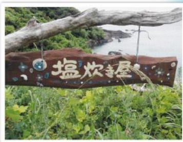
塩作り体験ができます。