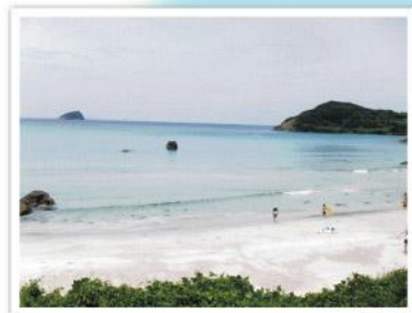
【根獅子の浜海水浴場】