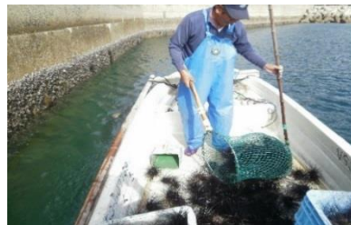
漁場の管理・改善に関する取組 (ガンガゼ駆除)