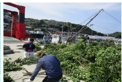
産卵場・育成場の整備に関する取組(イカ柴設置)