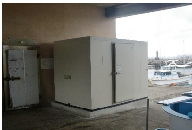
流通体制の改善に対する取組(貯氷庫整備)