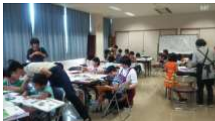
図書館スタッフと一緒に 楽しい「調べる学習」

7月27日、「図書館を使った調べる学習コンクール」のおたすけ講座を開催しました。当日は、27名の子どもたちが、自分が決めたテーマについて図書館の本を使って調べましたが、次々に明らかになる「新発見」に興味津々。夏休みの間、各自の調査結果をまとめた子どもたちから、コンクールへの多数の応募がありました。