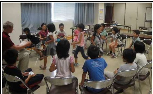
のびのびサマーJr.スクール H27/7 ~ 8月