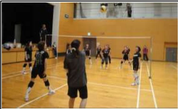
軽スポーツ(ソフトバレーボール) H27/ 6/ 5