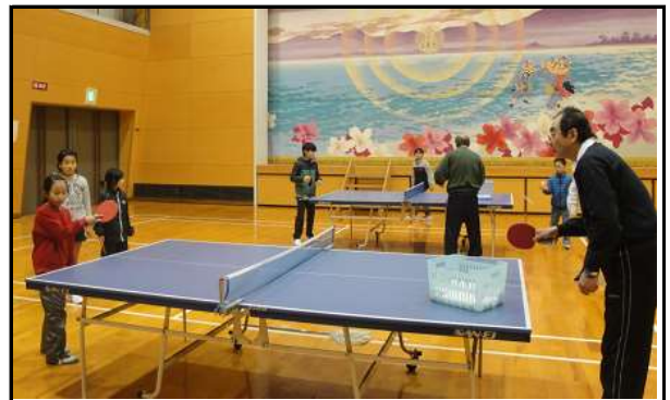
卓球教室H27/ 2/ 3 ~ 24