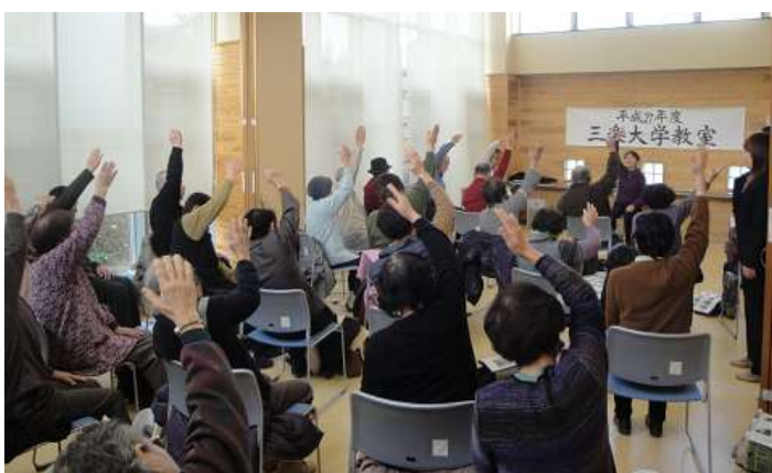
※写真は昨年度（介護予防教室）の様子です

28年度の三楽大学の今後の予定は右のとおりです。中部地区在住で65歳以上の方であればどなたでも参加できますので、お気軽にお問い合わせください。