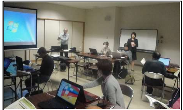
パソコン教室(全4回) H27/11/5~26 毎週木曜日