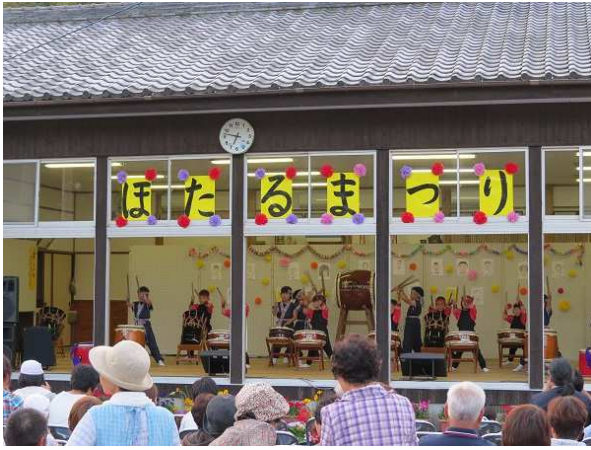
【 保育園児の和太鼓演奏 】