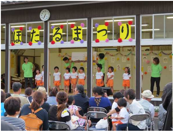
【 保育園児による合唱 】