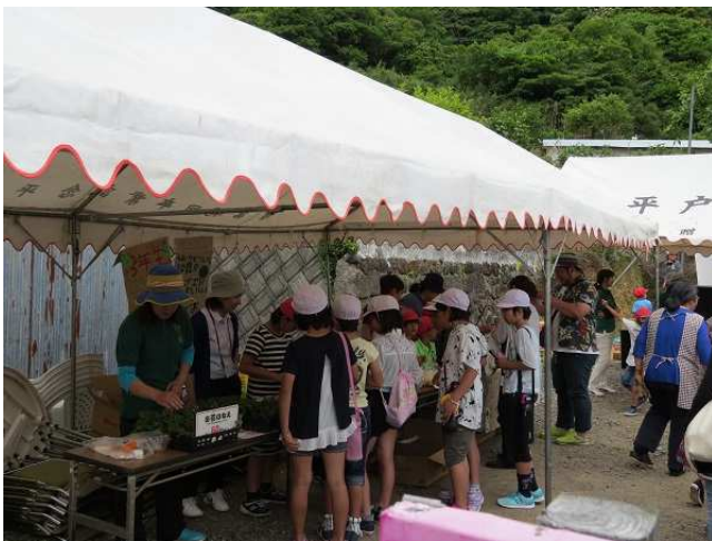
右 バザー販売 左 苗販売

みんなで作ったコースター一等を販売！ 花の苗も売りました。 きれいに咲くといいな！