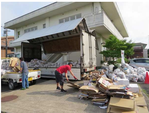
【 クリーンリサイクル活動風景 】

今回は、9月9日(土)に実施するようにしますので、皆さまのご協力をお願いします。