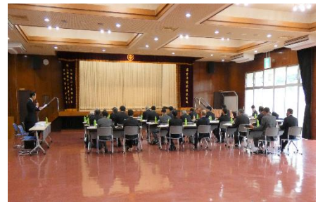
【南部地区区長連絡協議会】