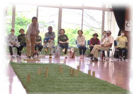
↑モルック大会の様子