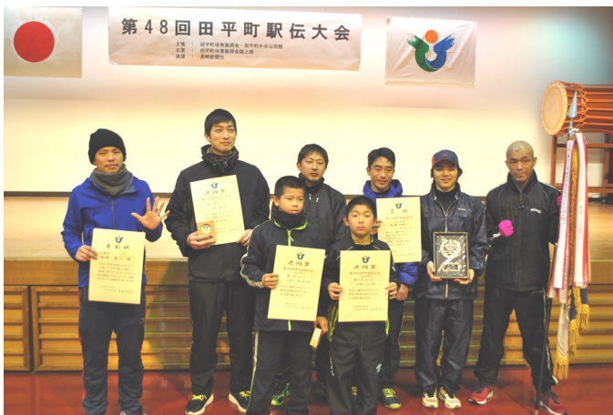
優勝 上里区 5連覇達成！！

第48回田平町駅伝大会において、多数回出場し、表彰された方は下記のとおりです。永年出場し大会を盛り上げていただき、ありがとうございます。今後ますますのご活躍を祈念いたします。