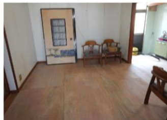
1階：フローリング②(コンパネ)