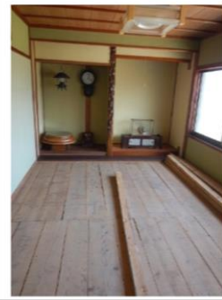
2階：フローリング②(コンパネ)