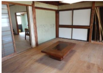
1階：フローリング①(コンパネ)