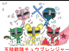
五稜戦隊チュウブレんジャー