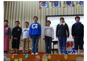
6年生「にじまるニュース15」