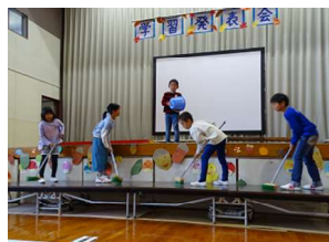
3年生「clap your hands」