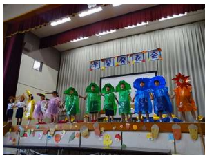
1年生「1年1組ガンバルマンズ」