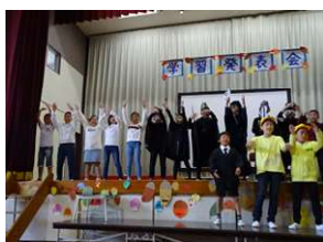
5年生「魔界とぼくらの愛戦争」