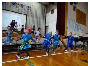
2年生「ドキワクニンニン」