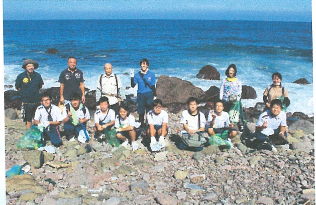
同じく 9/15 生月西海岸清掃↓