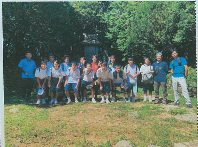
同じく 9/16 安満岳にて↓