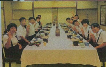
← 2日目 国際ホテル 菊池笹乃屋 での夕食！