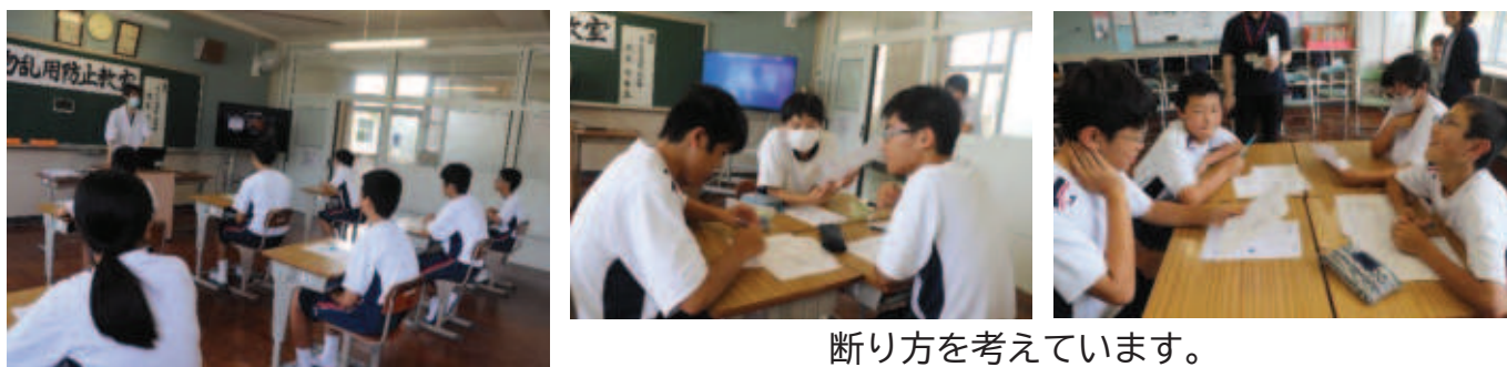
断り方を考えています。

また、中野中の先輩方等も含めた市内の中学生が、絵(デザイン)と言葉を考えて作成した、「薬物乱用防止カルタ」を使った学習も今後進めていきます。