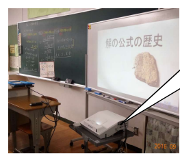
電子黒板機能付き短焦点型プロジェクター