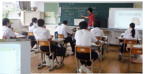
数学科の授業風景