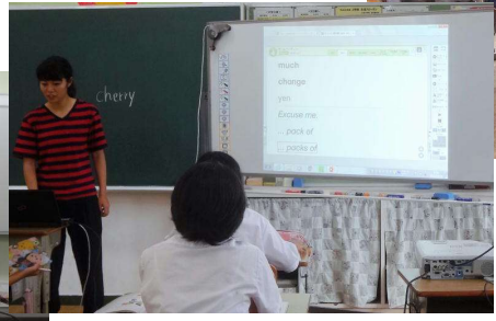
英語科の授業風景