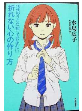
図書室の新刊本です。「10代は自分というものを作る時期」とありました。