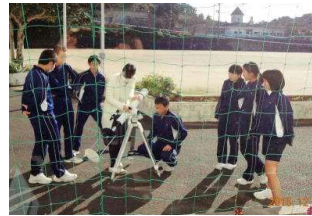
3年理科の授業 太陽の観測をしています