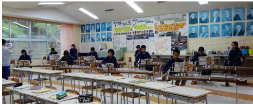
1年音楽の授業 琴の演奏をしています