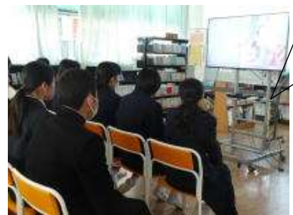
学習読書推進委員会による 絵本の読み聞かせ

中学生のみなさんは、例えば合唱やリズムダンスに対して思い(目標)を持って練習していると思います。オリンピック選手たちの中にも、4年前に悔しい思いをして、それをバネに練習を重ね、この舞台に立っている選手がいます。4年間思いを持ち続けるというのはすごいと思います。「持続する志」という言葉を聞いたことがあります。「持続する」ということは大切だと思います。そして、「持続して初めて見えてくるものがあるような気がします。」「持続する」というものが「生きる」ということでもあるのかなとも思います。