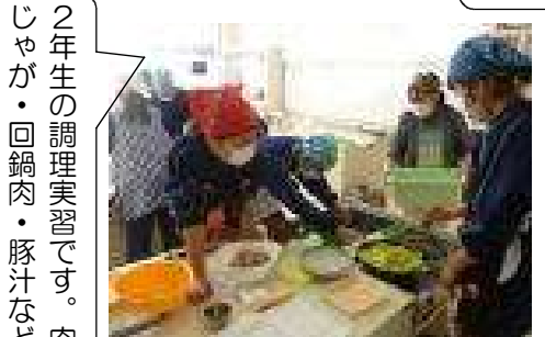
2年生の調理実習です。肉じゃが・回鍋肉・豚汁など

今年度も残り少なくなってきました。ついこの前、3学期が始まったと思ったら、もう2月半ば、卒業式まであと1か月となりました。一日一日を大切に過ごしていかなければなりませんね。今後の予定をお知らせします。